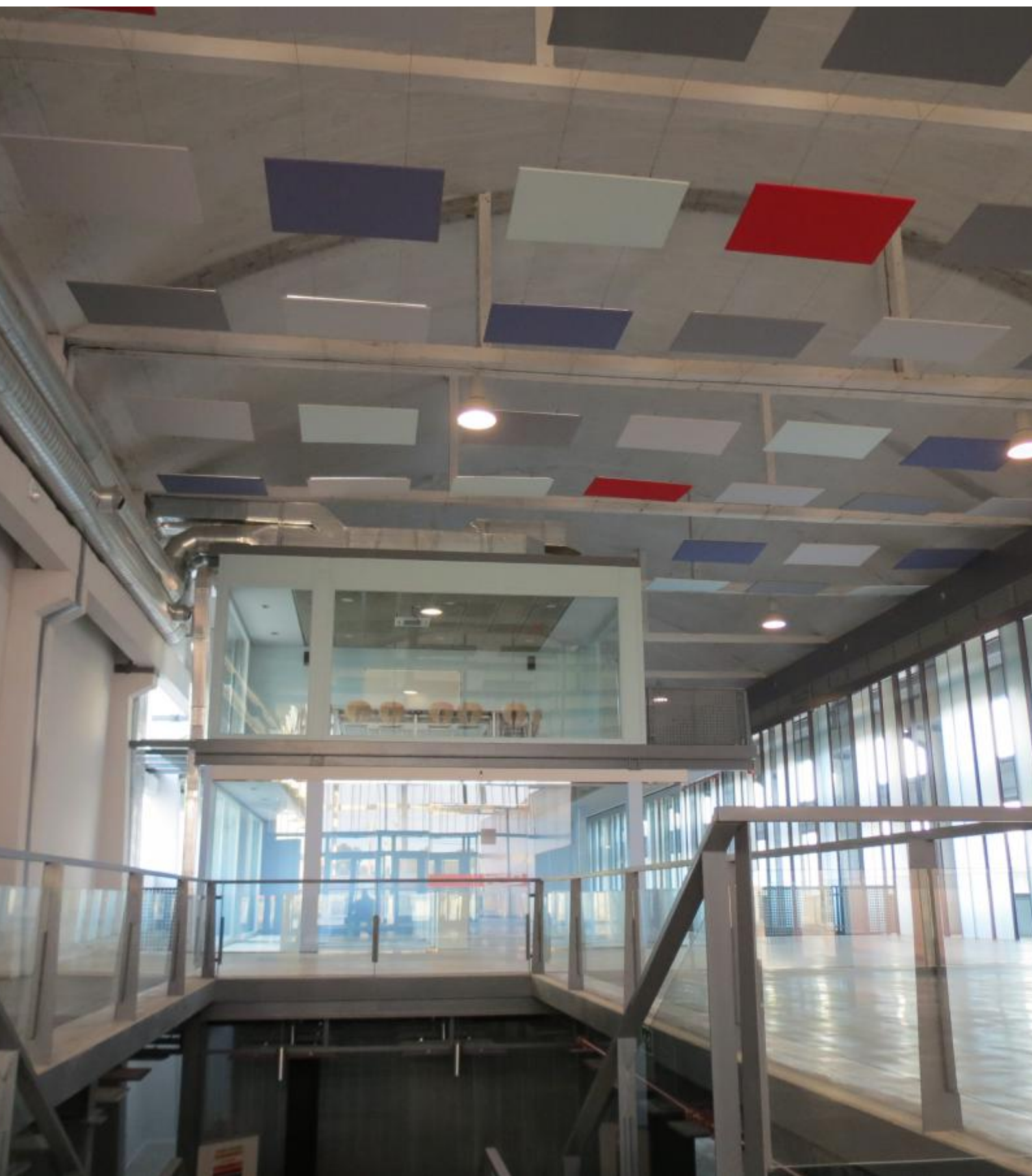
El Centro del Conocimiento Aldealab, integrado por los edificios Embarcadero y Garaje 2.0. alberga la sede central del CENTRO EUROPEO DE EMPRESAS E INNOVACIÓN DE EXTREMADURA (CEEI de EXTREMADURA), que el Gobierno de Extremadura, FUNDECYT-